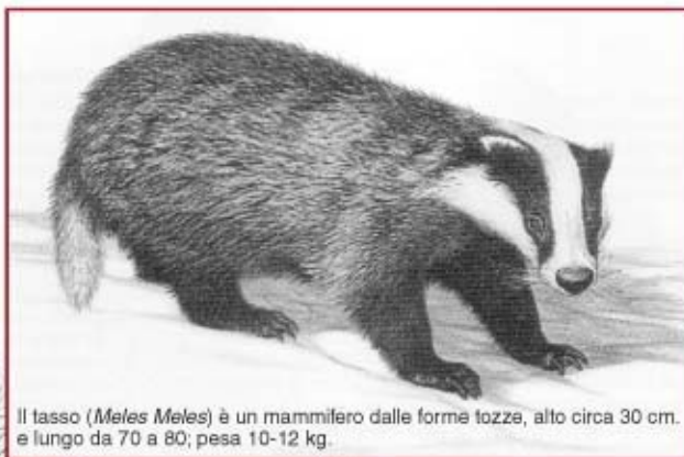
Il tasso ( Meles Meles ) è un mammifero dalle forme tozze, alto circa 30 cm. e lungo da 70 a 80; pesa 10-12 kg.

La strada sale ancora nel bosco all'ombra, piuttosto fangosa. Poi si apre di colpo sul valico su due valli, di fronte al Bricco delle Pietre (443 m.). Sul piano, molto suggestivo, una bella quercia affiancata da un cespuglio di corniolo segna l'incrocio con la strada sterrata che da Borgatello va ad Odalengo Grande. Si prende a sinistra, tuffandosi nuovamente nel bosco; ai rami degli alberi alcuni nidi artificiali appesi da qualche animo "verde". Sulla